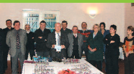
Cérémonies des vœux du Maire au personnel communal du 6 janvier 2007

Je m'associe au Conseil Municipal pour vous adresser nos meilleurs vœux pour 2007, pour vous-mêmes et vos familles. Meilleurs vœux également aux nombreuses associations locales, leur souhaitant une pleine réussite dans leurs activités variées, qui offrent aux habitants de Lit et Mixe des possibilités de participation active à la vie de notre commune et facilitent l'intégration des nouveaux résidents.